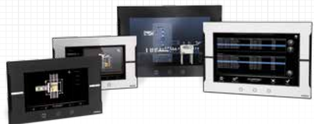
Modelos panorâmicos de 7, 9, 12 y 15"